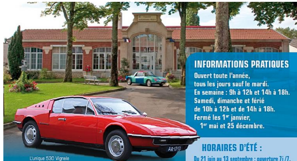
L'unique 530 Vignale