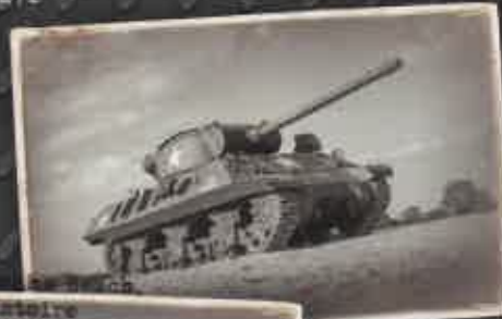
au coeur de l'histoire Between Utah and Omaha Beach Right in the heart of history

SITE HISTORIQUE A 10 AIRFIELD CARENTAN-CATZ