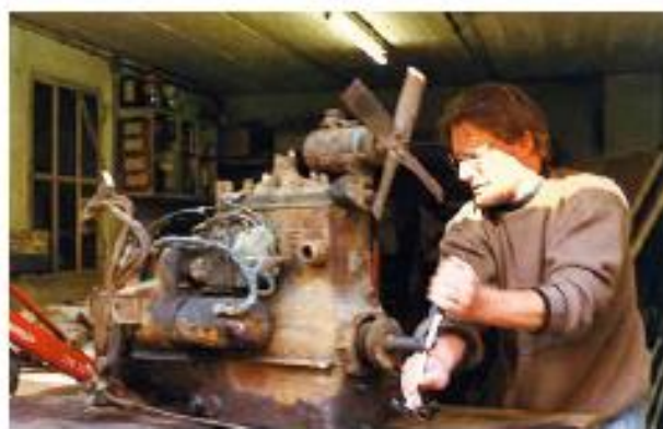
Démontage d'un moteur Mathis MY en vue d'une restauration, c'était en 1995.

de collection. Le rassemblement compte plus de 400 véhicules certains mois, en majorité de la région, mais aussi d'Allemagne et de Suisse. C'est un lieu de ralliement, mais aussi de passage de différents rallyes, toujours accueillis avec plaisir et camaraderie. Quoi de plus simple que de réunir les propriétaires et les visiteurs pour échanger s'informer et partager, le tout agrémenté par un bulletin de liaison mensuel.