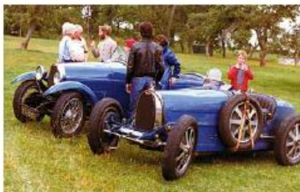
Virée en Angleterre avec mes parents en Bugatti Type 40 CS. On me voit à l'arrière-plan, j'ai 10 ans.

Le rendez-vous mensuel est fixé chaque premier dimanche du mois, dans l'esprit d'ouverture des musées. Rétrorenard est depuis le carrefour des amateurs et des passionnés, rassemblant des modèles de toutes marques et de tous âges, mais de plus de trente ans. Un des objectifs est de faire aimer la voiture ancienne par la promotion et la sauvegarde du patrimoine. L'exposition gratuite (et adhésion gratuite) est ouverte à tous publics. À juste titre, un point info FFVE a par ailleurs été mis en place pour pallier aux questions nombreuses et très variées sur l'automobile