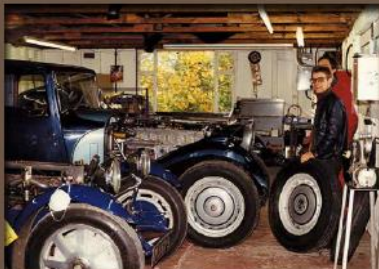
À 20 ans, en 1988, me voici à l'entretien et à la restauration des Bugatti chez A.B. Price Ltd. en Angleterre. Au premier plan, "PJB79", celle de la page de couverture en restauration !

Au gré de mes virées automobiles, en France et dans les pays limitrophes, me voici réuni avec une bande d'amis, le dimanche à dix, puis quinze, puis vingt voitures de collection. D'où va germer l'idée de la création de l'association Rétrorenard « pour la promotion et la sauvegarde du patrimoine automobile et motocycliste en Alsace », au début des années 2000.