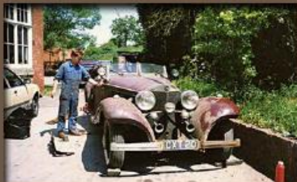
Découverte de la Mercedes 500K. Il faudra deux jours et un mur démolit pour la sortir du sous-sol où elle était oubliée depuis trente-deux ans.