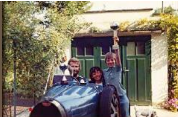
Photo de famille. À 13 ans, en 1981, avec la gagnante de la course de côte de Turckheim Trois-Épis