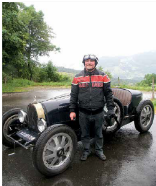
Souvenir de 2008 où quand il pleut, c'est encore mieux. En témoigne le sourire du pilote de la Bugatti Type 35 de 1929.

Collectionneur hétéroclite, j'ai le souci propre à la plupart des collectionneurs : je m'intéresse à tout ce qui a un