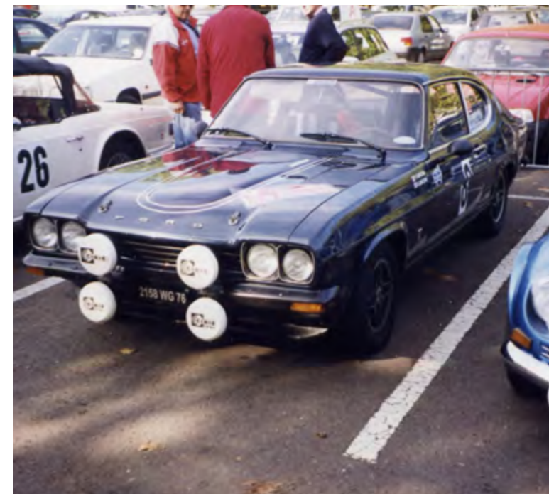
Au volant d'une Ford Capri 2 litres RS lors du Rallye de Beaune en 2004.

teurs de manifestations des départements de cette belle région. Son rôle est de répondre à leurs questions et de faire connaître les actions capitales menées par la FFVE en faveur des clubs et des collectionneurs. Il conseille naturellement les collectionneurs dans leurs demandes d'attestations pour obtenir la carte grise de Collection et participe, en fonction de ses disponibilités, aux assemblées générales des clubs locaux. C'est toujours un plaisir pour lui que de les guider et de les conseiller au mieux. Yvon espère aussi que de nombreux Clubs, qui ne sont pas encore affiliés à la FFVE, rejoindront ses rangs tant les avantages qu'ils peuvent en tirer sont importants pour eux et pour leurs membres. En effet, comme il aime à le dire, « Plus nous serons nombreux, plus nous serons entendus par les Pouvoirs Publics et les collectivités locales. Et cela est particulièrement important en ces temps autophobes. » □