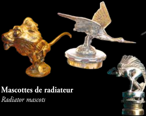
Mascottes de radiateur Radiator mascots