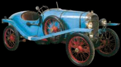
Amilcar CV - 1923 Type C4 - Moteur 4 cyl. 6 CV - 904cc Type C4 - Four cylinder 6 CV - 904cc