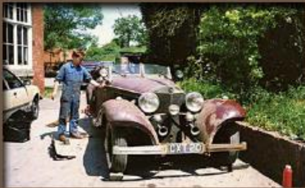
Découverte de la Mercedes 500K. Il faudra deux jours et un mur démolit pour la sortir du sous-sol où elle était oubliée depuis trente-deux ans.