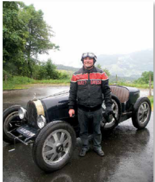
Souvenir de 2008 où quand il pleut, c'est encore mieux. En témoigne le sourire du pilote de la Bugatti Type 35 de 1929.

Collectionneur hétéroclite, j'ai le souci propre à la plupart des collectionneurs : je m'intéresse à tout ce qui a un